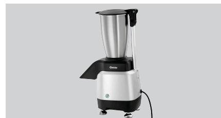
► Leistungsstark ✓ 120 kg / Stunde