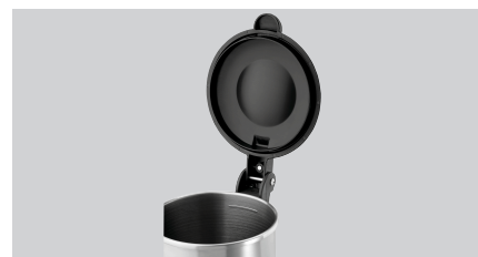
► Mehr Sicherheit ✓ Magnetkontaktschalter am Deckel ✓ 4 rutschfeste Standfüße